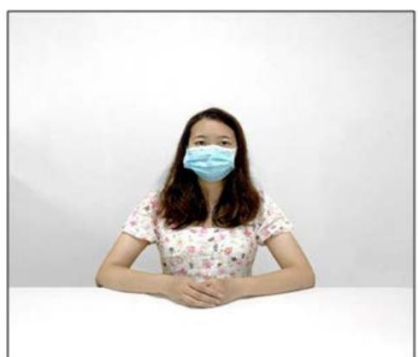
图2：正前方第一机位效果图