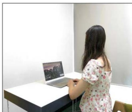
图3：侧后方第二机位效果图